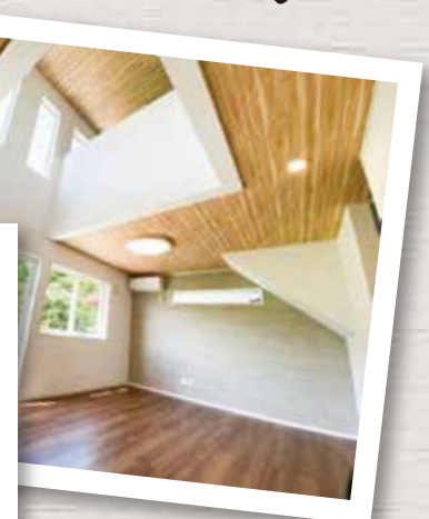
※イメージ写真・当社施工事例