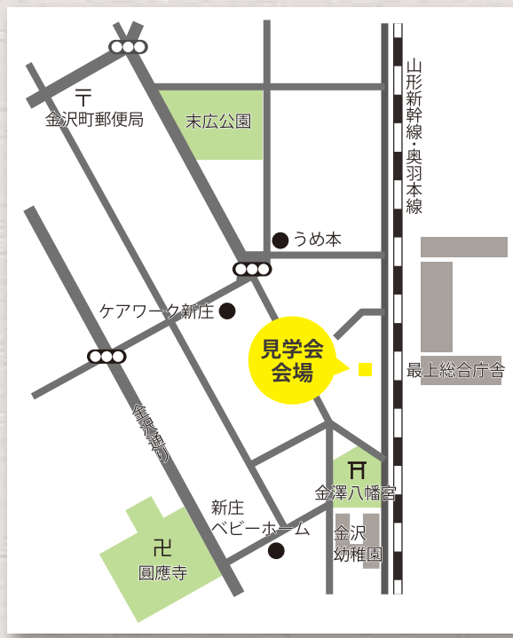
新庄市上金沢町(金沢幼稚園近く)

※お施主様のご厚意により開催させていただきます。 ※駐車場をご用意しております。決まった場所への駐車をお願い致します。 ※予約制ではありませんが、来場者様が10名以上となった場合、お待ちいただく場合がございます。また、詳しいご相談をご希望の方はご予約をおすすめしております。弊社ホームページのイベント予約フォームよりお問い合わせください。